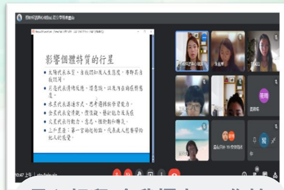
星心相印-自我探索 工作坊