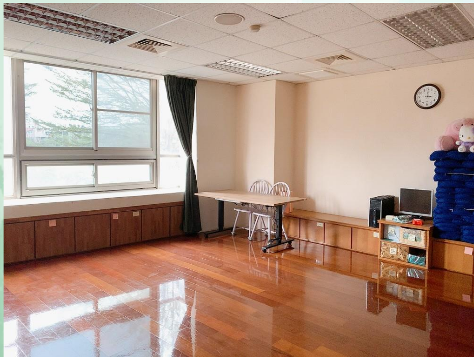
資源教室暨團體諮商室