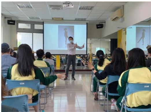
「溫心大使」系列課程—心情 FUN輕鬆~聊聊情緒與壓力調適