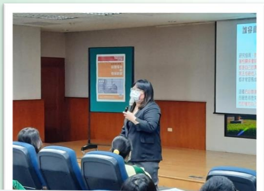
「蜜糖中的毒藥-談關係中的情緒勒索」講座